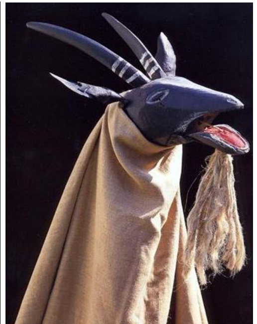
Bába s nůží, Bakus a koza ( Milevsko ); repro Masky, démoni, šaškové, Theo, Pardubice 1999