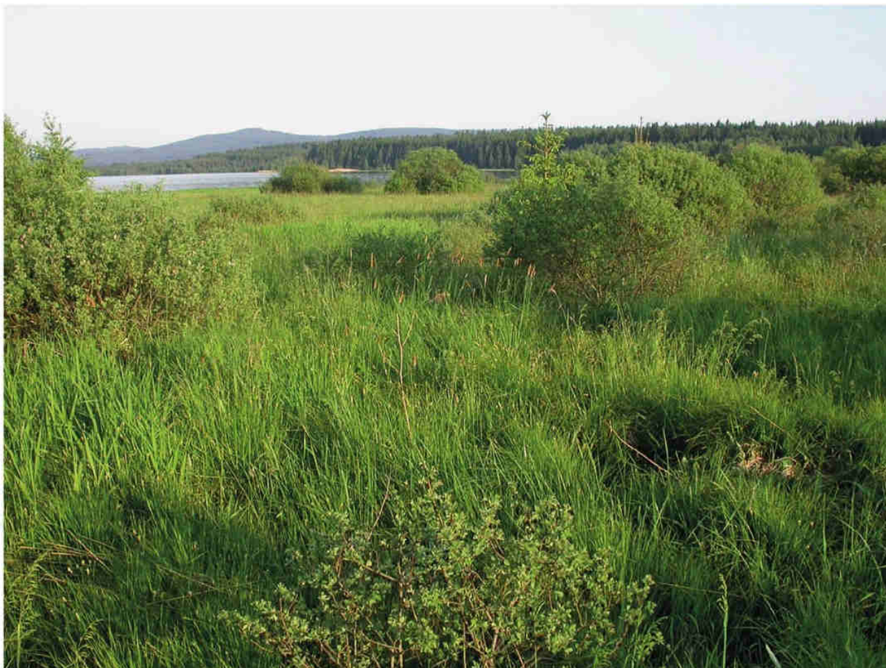
Obr. 6 – Přírodní rezervace Pod Borkovou.

Fig. 6 – Pod Borkovou Nature Reserve.