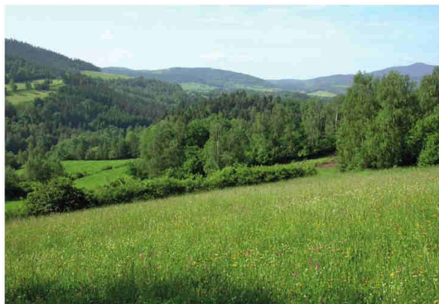
Obr. 4 – Přírodní památka V polích (foto J. Šumpich 2010).

Fig. 3 – Míchov Nature Reserve (photo by J. Šumpich 2009).