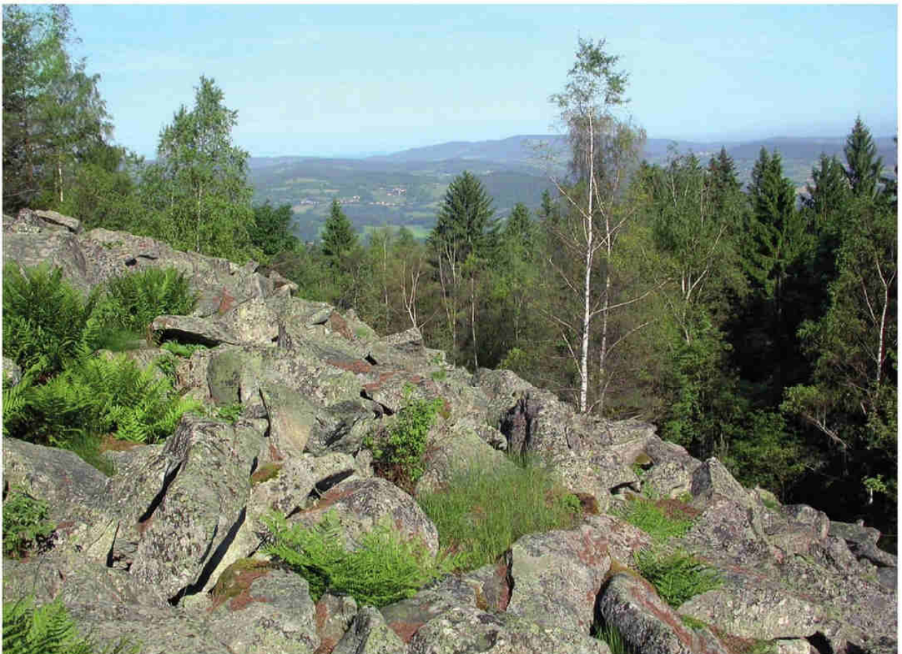
Obr. 2 – Přírodní památka Mažský vrch. Fig. 2 – Mažský vrch Nature Monument.