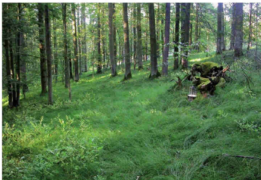
Obr. 3 – Přírodní rezervace Míchov.

Fig. 3 – Míchov Nature Reserve.