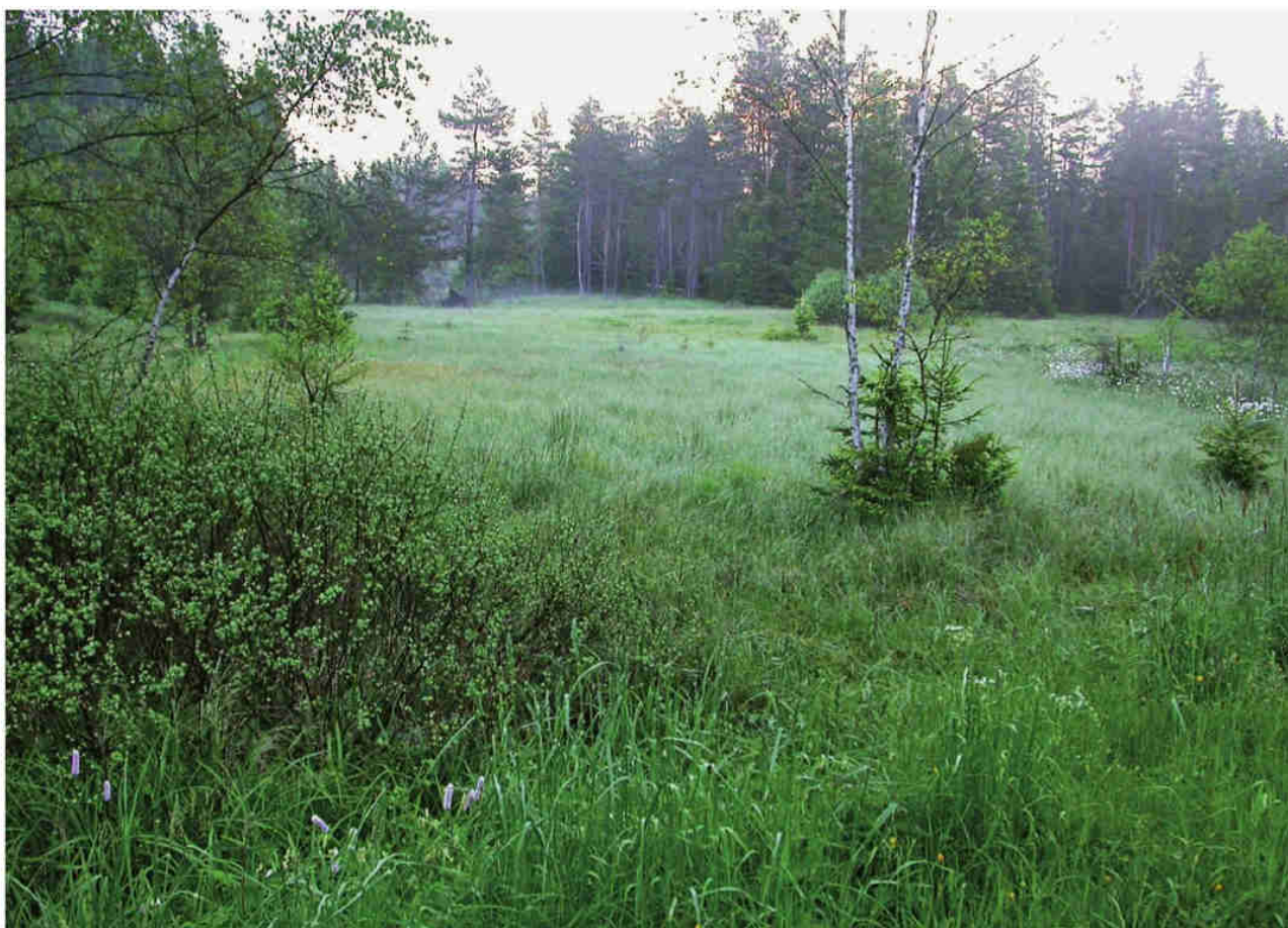
Obr. 7 – Přírodní památka Multerberské rašeliniště.

Fig. 6 – Pod Borkovou Nature Reserve.