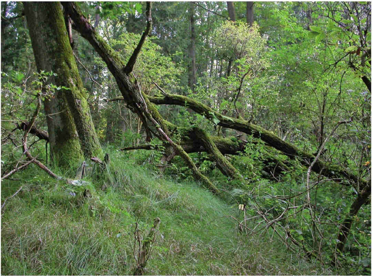
Obr. 1 – Přírodní rezervace Bažantnice u Pracejovic. Fig. 1 – Bažantnice u Pracejovic Nature Reserve.