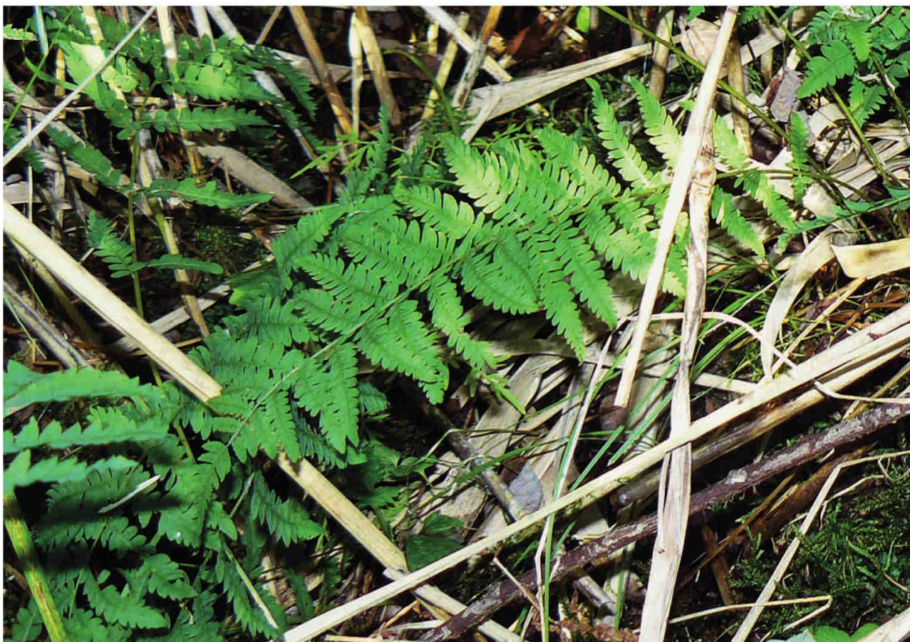
Obr. 7 – Thelypteris palustris na lokalitě u Střížovic na Českomoravské vrchovině (foto P. Hesoun 2011).

Fig. 6 – Malaxis monophyllos near Studánky village (photo by J. Janáková 2011).