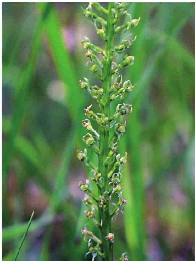
Obr. 6 – Malaxis monophyllos na lokalitě u Studánek v Kaplickém mezihoří.

Fig. 5 – Bromus japonicus in the southeastern part of the forest on Plešovec hill near Bojanovice village.