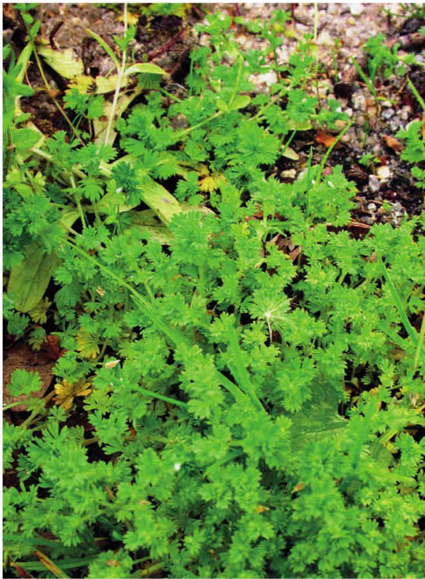
Obr. 1 – Aphanes australis , Staňkov, severozápadní břeh Staňkovského rybníka.

Fig. 1 – Aphanes australis , near Staňkov village, the northwestern bank of Staňkovský rybník pond.