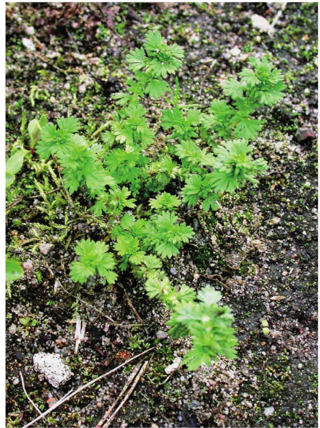
Obr. 2 – Aphanes australis , Hamr, část Kosky, písčité plocha v rekreačním zařízení.

Fig. 1 – Aphanes australis , near Staňkov village, the northwestern bank of Staňkovský rybník pond.