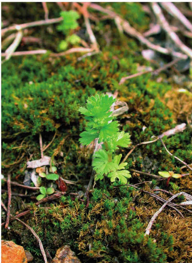
Obr. 3 – Aphanes australis , Vlkov, okraj písčitého políčka u hájovny v obci (foto J. Blahovec 2004).

Fig. 2 – Aphanes australis , Kostky village, near Hamr village, sandy area in camping site (photo by J. Blahovec 2011).