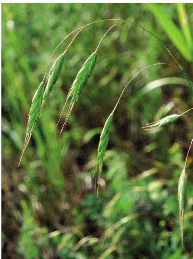
Obr. 5 – Bromus japonicus na jihovýchodním úpatí lesa na vrchu Plešovci u Bojanovic.

Fig. 5 – Bromus japonicus in the southeastern part of the forest on Plešovec hill near Bojanovice village.