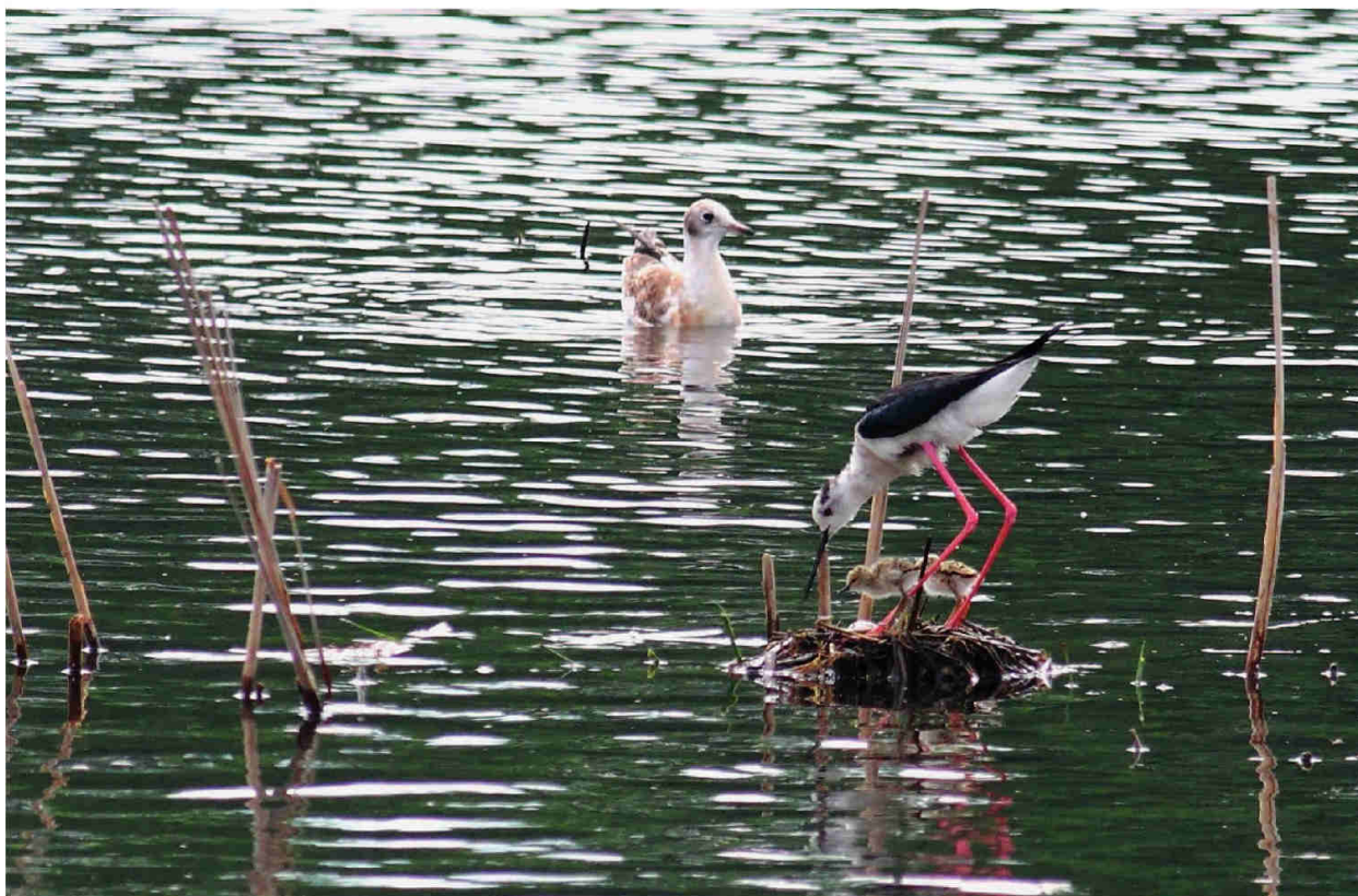
Obr. 7 – Čerstvě vylíhlá kuřata pisily čáponohé ( Himantopus himantopus) na hnízdě v zarostlé západní části Nového Vrbenského rybníka.

Fig. 6 – Breeding ground of Black-winged Stilt ( Himantopus himantopus) in overgrown western part of Nový Vrbenský Pond.