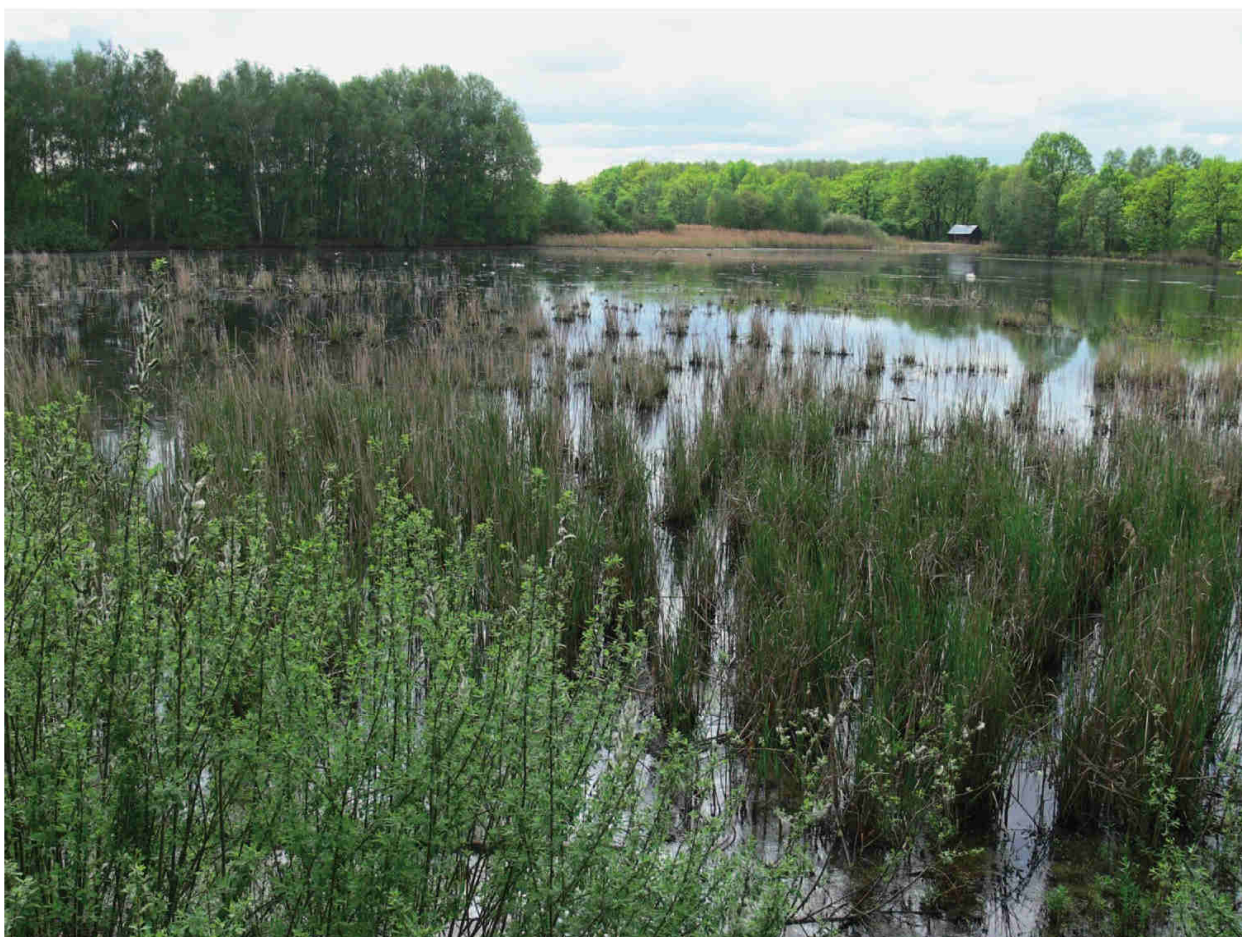
Obr. 6 – Hnízdiště pisil čáponohých ( Himantopus himantopus) v zarostlé západní části Nového Vrbenského rybníka.

Fig. 6 – Breeding ground of Black-winged Stilt ( Himantopus himantopus) in overgrown western part of Nový Vrbenský Pond.