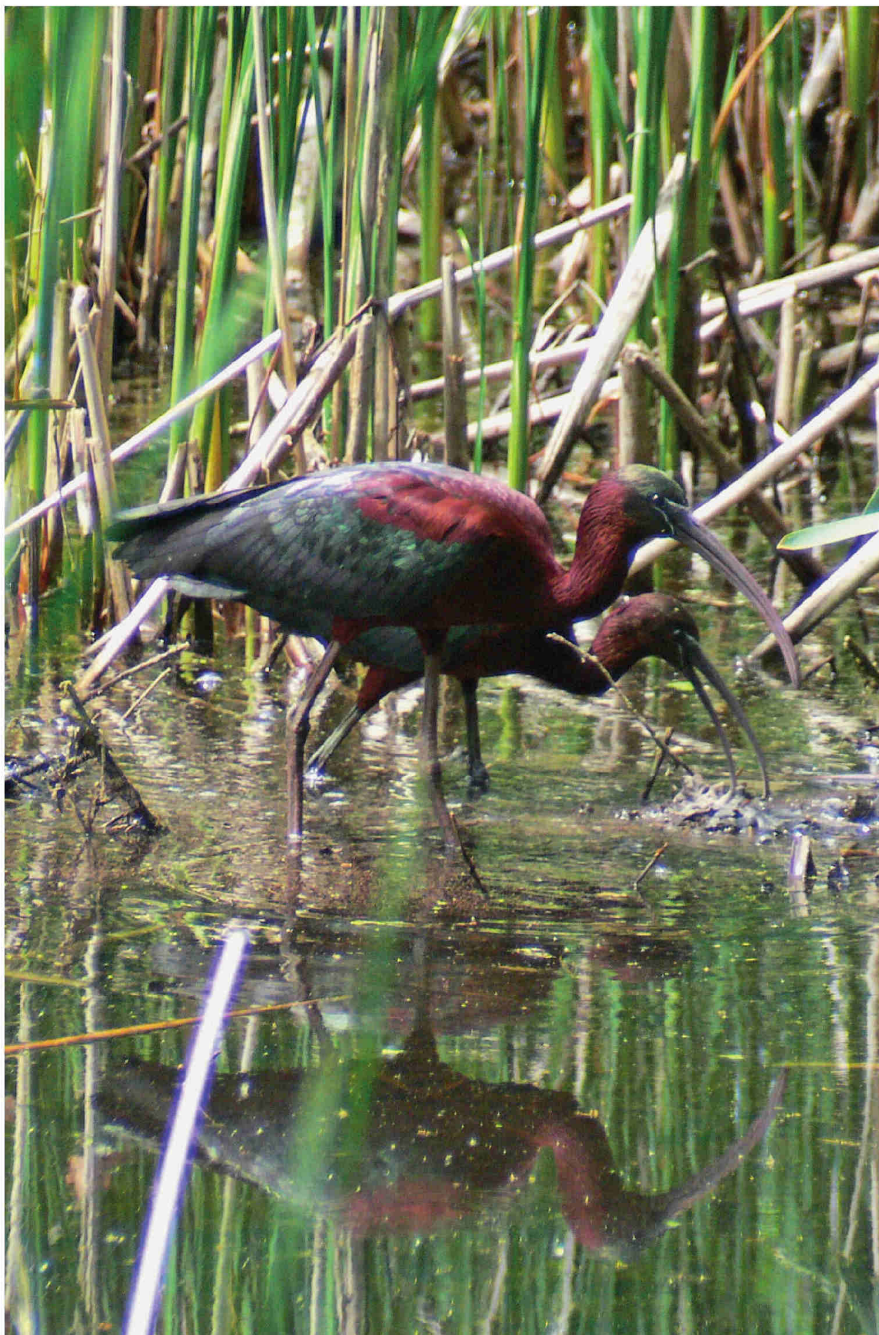
Obr. 5 – Dospělí ibisové hnědí ( Plegadis falcinellus) při sběru potravy v zarostlé západní části Nového Vrbenského rybníka.

Fig. 5 – Foraging adult Glossy Ibises ( Plegadis falcinellus) in overgrown western part of Nový Vrbenský Pond.