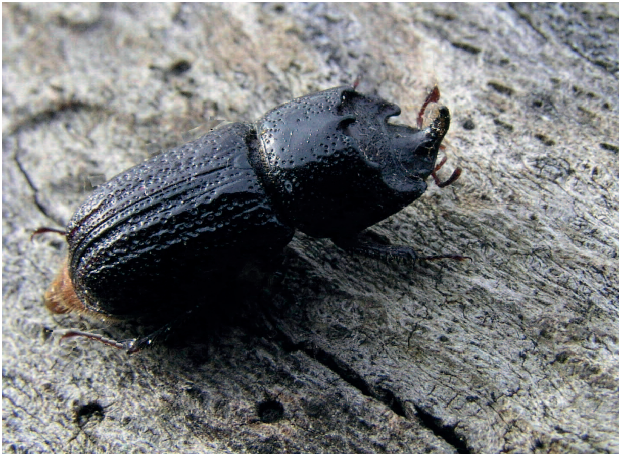
Obr. 2 – Roháček bukový ( Sinodendron cylindricum), Klet'. Fig. 2 – Horned stag Rhinoceros Beetle ( Sinodendron cylindricum), Klet'.