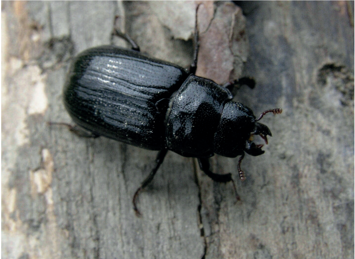
Obr. 1 – Roháček jedlový ( Ceruchus chrysomelinus), Žofínský prales. Fig. 1 – Fir stag Beetle ( Ceruchus chrysomelinus), Žofínský prales.