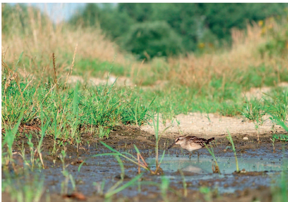
Obr. 4 – Jespáček ploskozobý ( Limicola falcinellus ) u malé louže na vojenském cvičišti, Jindřichův Hradec (srpen 2014). Fig. 4 – Broad-billed Sandpiper ( Limicola falcinellus ) next to a small puddle in a military training area, Jindřichův Hradec (August 2014).