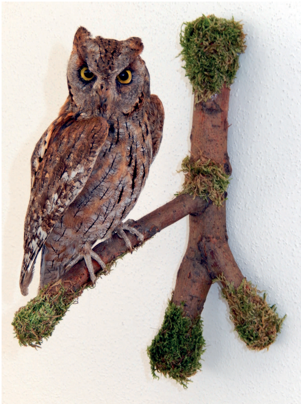
Obr. 5 – Preparát výřečka malého ( Otus scops ), Vrábče, květen 2001. Fig. 5 – Mounted specimen of the Eurasian Scops Owl ( Otus scops ), Vrábče, May 2001.