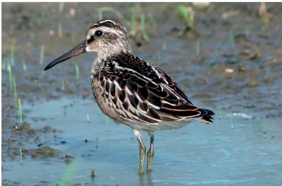
Obr. 3 – Mladý jespáček ploskozobý ( Limicola falcinellus ), Jindřichův Hradec (foto J. Jirsa srpen 2014). Fig. 3 – Young Broad-billed Sandpiper ( Limicola falcinellus ), Jindřichův Hradec (photo by J. Jirsa August 2014).