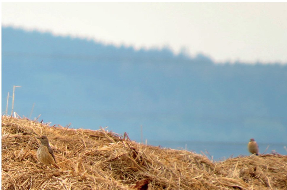
Obr. 6 – Jedinec, zřejmě samice, skalníka zpěvného ( Monticola saxatilis) na polním hnojišti, Mahouš na Prachaticku.

Fig. 6 – An individual, probably female of Rufous-tailed Rock-thrush ( Monticola saxatilis) on a dunghill in the field, Mahouš, Prachatice district.