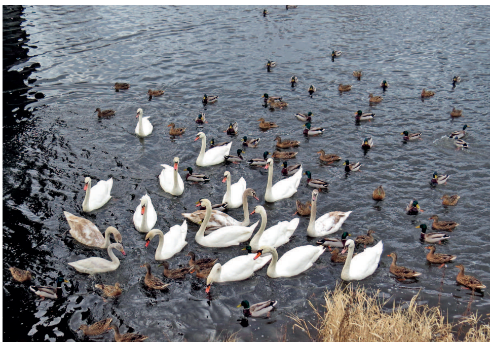
Obr. 2 – Nedospělá labuť malá ( Cygnus columbianus) vlevo dole společně s labutěmi velkými ( Cygnus olor) a kachnami divkými ( Anas platyrhynchos) na místě pravidelného přikrmování vodních ptáků na řece Vltavě v Českých Budějovicích.

Fig. 1 – Immature Tundra Swan ( Cygnus columbianus) on the left together with immature Mute Swan ( Cygnus olor) on the river Vltava in České Budějovice.