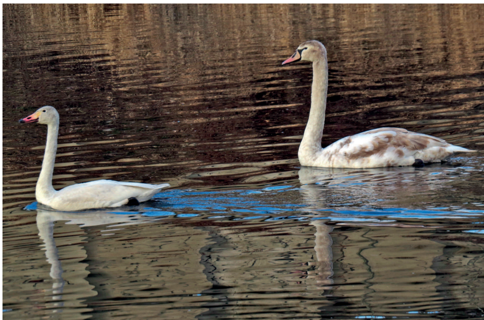
Obr. 1 – Nedospělá labuť malá ( Cygnus columbianus) vlevo společně s nedospělou labutí velkou ( Cygnus olor) na řece Vltavě v Českých Budějovicích.

Fig. 1 – Immature Tundra Swan ( Cygnus columbianus) on the left together with immature Mute Swan ( Cygnus olor) on the river Vltava in České Budějovice.