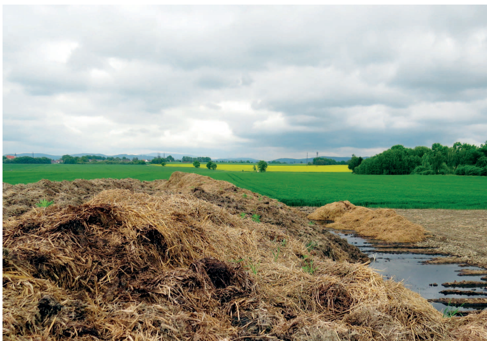
Obr. 7 – Polní hnojiště, biotop výskytu skalníka zpěvného ( Monticola saxatilis), Mahouš na Prachaticku.

Fig. 6 – An individual, probably female of Rufous-tailed Rock-thrush ( Monticola saxatilis) on a dunghill in the field, Mahouš, Prachatice district.