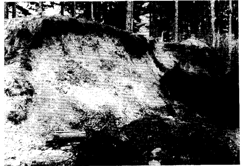
Foto 1 — Odkrytá halda v jižní části lokality č. 8.

Im Vergleich mit dem von Slavík (1974) aus dem Südtel der Gegend von Pacov angeführten Artenverzeichnis (556 Arten) wurden durch die Arbeitsgemeinschaft im untersuchten Gebiet weitere 74 Pflanzenarten gefunden, so dass in der Gegend von Pacov gegenwärtig 630 Arten bekannt sind.