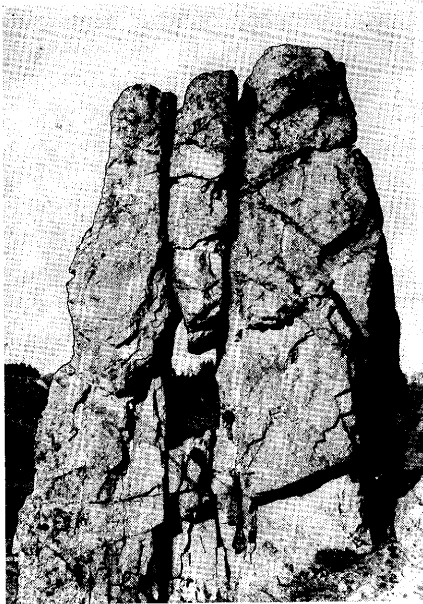
Foto 2 — Skalní okno v níže položeném pilíři; průhled směrem k západu.