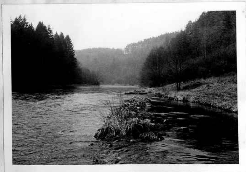
Foto. 3 - Náplavové ostrovy jsou místa, kde se nejčastěji můžeme setkat s vegetací splavenou z vyšších poloh